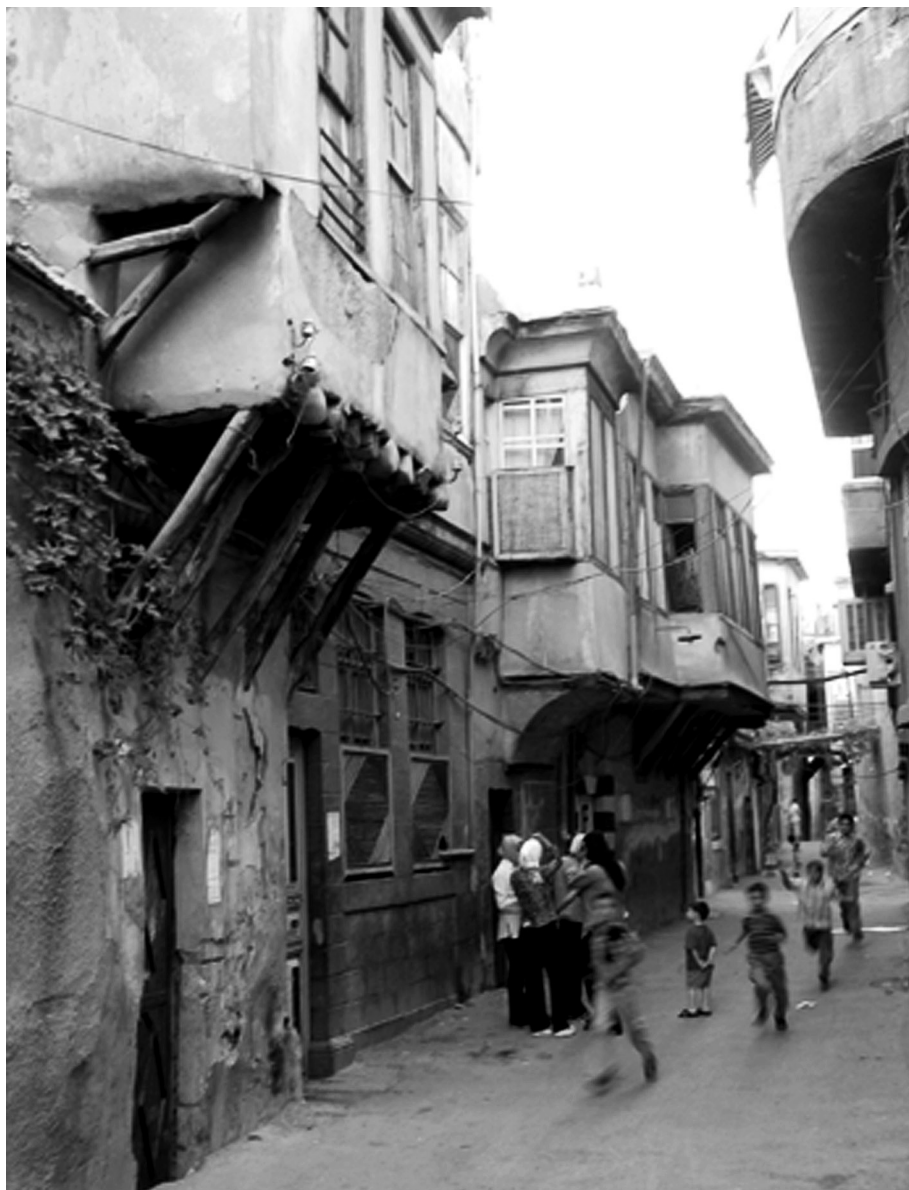
Photo 2 : Ruelle dans le quartier Souk Sarouja © Photo by www.myham.com/Damas, 2003.

La décision de classer ou de protéger revient en fin de compte aux autorités syriennes. On peut alors se demander quelles sont les difficultés rencontrées ? Ou encore, quelle peut être la perception locale des lieux protégés et en quoi la participation de la société civile s'avère utile ?